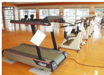
仕事帰りに、ひと汗どうぞ。

「悠・友・湯・遊」、いろいろな「ゆう」の意味を持つ「ゆうゆうぷらざ」。家族や友人と一緒に、ゆったり、のんびりご利用してみませんか。 問 ☎62-2662 場 神湊118番地4