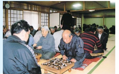
囲碁。みなさん真剣です。