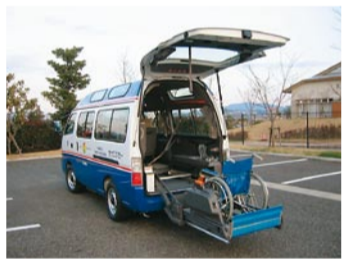
車イスのまま乗り降りできます。