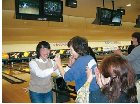
やったね、ストライク

共催 宗像市ボウリング協会 宗像シティボウル 後援協賛(順不同、敬称略) 宗像市/宗像市商工会/宗像市議会/宗像市職員労働組合/宗像市民生・児童委員協議会/社団法人宗像市シルバー人材センター/リコー九州株式会社/株式会社玉置/グローバルアリーナ/宗像市福祉ボランティア活動連絡協議会/宗像青