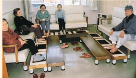
ヘルストロン。1度に9人まで利用できます。