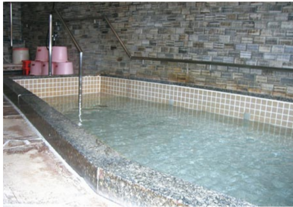
大浴場。毎日お湯を入れかえています。気持ちいいですよ。