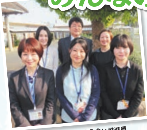
私たちが、地域支え合い推進員(生活支援コーディネーター)です

市社会福祉協議会では、みなさんの理解と協力を得て地域福祉を進めています。今年度も次のような事業を進めていきます。 なお、個別事業の詳細については、本会ホームページを参照してください。