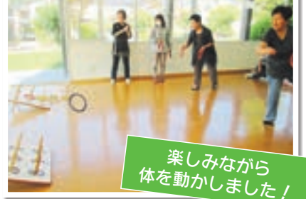
楽しみながら体を動かしました!