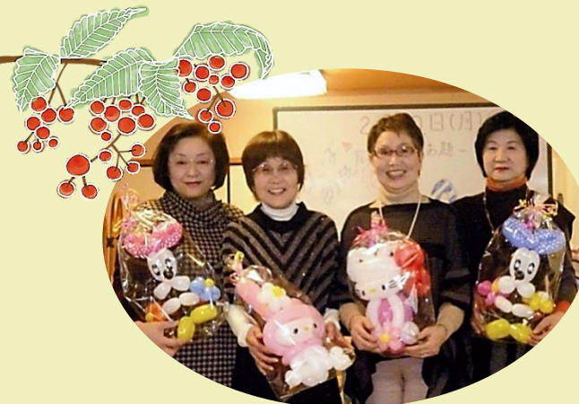
高齢者施設での朗読会にて*