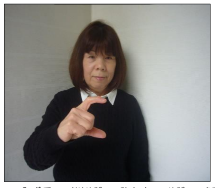
③右手の親指と人差し指を少し曲げて、日の形をする。