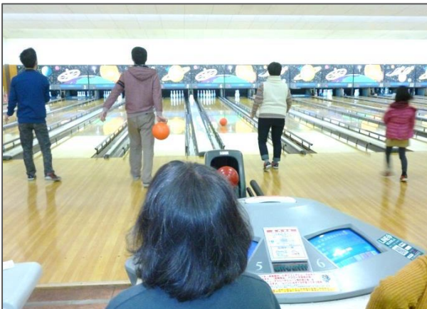
▲頑張るぞ!! ボウリング開始