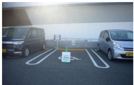
▲ふくおか・まごころ駐車場有ります

※オストメイトとは、人工肛門や人工膀胱保有者の方を指しています。オストメイトの方は、病気などによって、臓器に機能障害を負い、腹部に人工的に排泄のための孔（ストーマ）を造設しており、従来のトイレでの排せつ行為においては様々な苦勞があります。