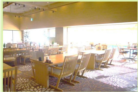
▲ゆったりとした食事スペース