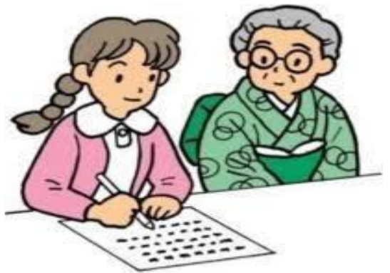
▲手書きで要約する様子