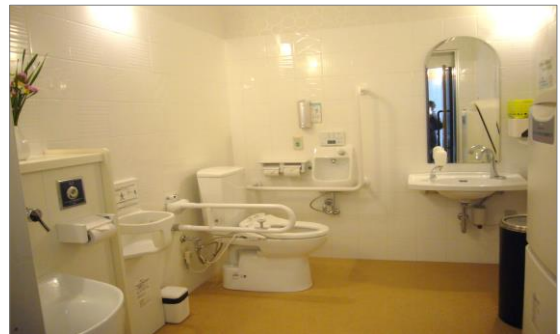
▲広いスペースに手すり付きシャワートイレ ※オストメイト対応です