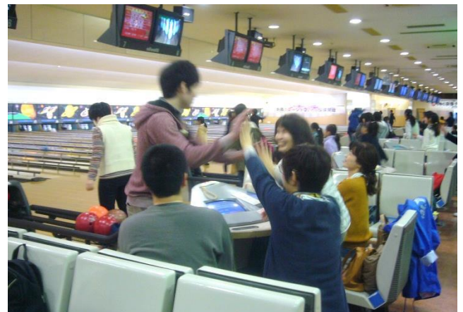
▲ストライクでハイタッチ!!