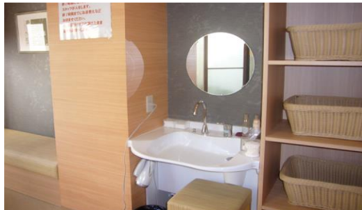
▲家族風呂洗面所は車いす利用者にあわせて低めに設定しています