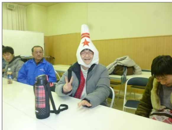
▲参加者の満面の笑顔