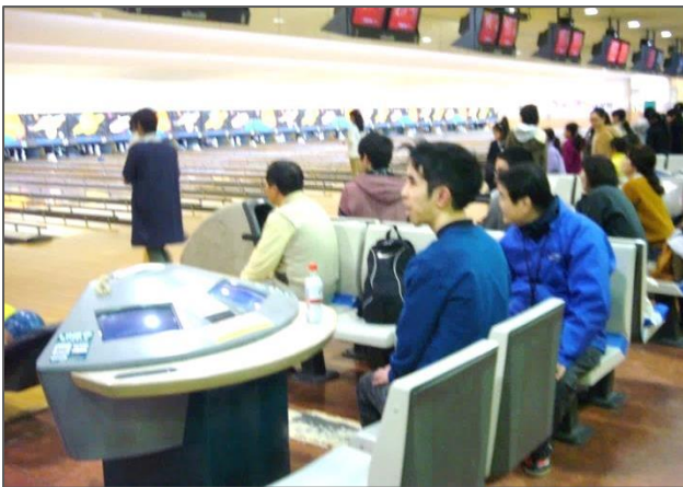
▲熱心に見つめる参加者