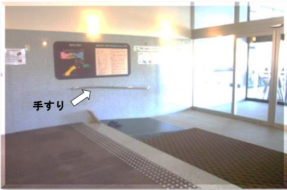
▲スロープのある玄関と手すり ◎車いす貸出有ります（2台）

むなかたしおうまる 宗像市王丸474 えいぎょうじかん じ じ さいしゅうにゆうかんうけつけ じ 営業時間：10時～24時（最終入館受付23時） しょくじ じ じ 食事：11時～22時（オーダーストップ21時30分） ていきゅうび まいつきだい すいようび 定休日：毎月第3水曜日 しゅくさいじつ ばあい よくしゅう すいようび ※祝祭日の場合は、翌週の水曜日 TEL 0940-37-4126