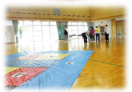
▲ポイントゲームの様子