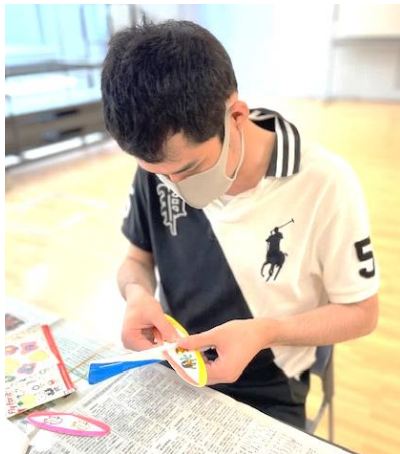
▲集中している参加者