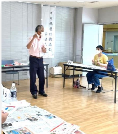
▲わかりやすく手順を説明