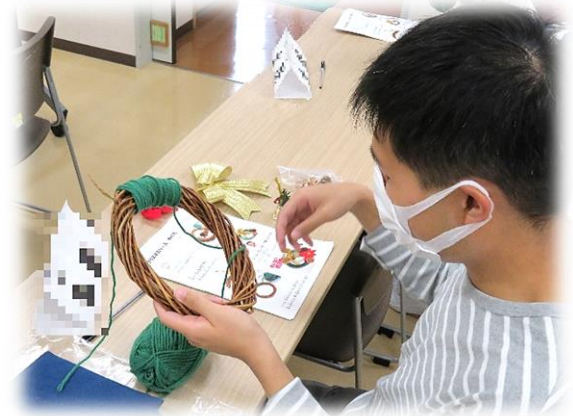
▲毛糸を巻くのが難しい~!!

令和4年11月13日(日曜日)、河東地区コミュニティセンターでクリスマスリースを作りました。今回の参加者は8人。土台となるリースに毛糸を巻く作業に苦戦しましたが、最後に飾り付けをして素敵なリースが出来上がりました。基本的な感染症対策として手指の消毒、換気のほか密にならないように少人数で開催しました。この事業にご協力いただいた皆さん、ありがとうございました。