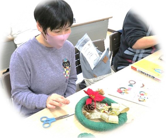
▲飾りの位置はここに決めた!!