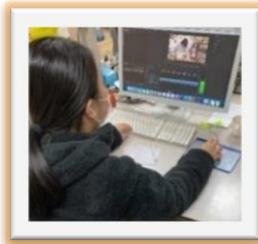
▲パソコン作業の様子