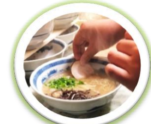
▲飲食店での作業の様子