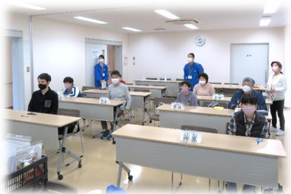
▲事業スタート!!ワクワク♪