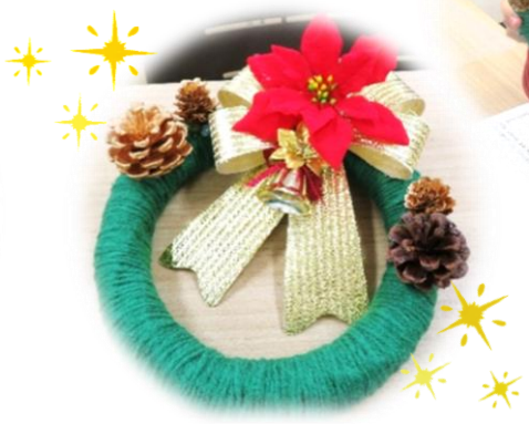
▲クリスマスリース完成