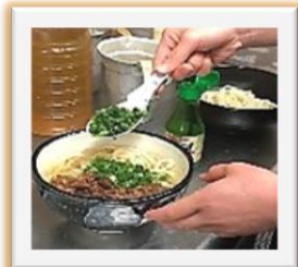
▲飲食店での作業の様子

せいかつくんれん 生活訓練とは... 自立して日常生活を送ることができるよう、規則正しい生活リズム、身体機能、マナーなどを身につける訓練や支援を行う福祉サービスです。