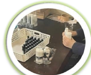
▲施設内作業の様子