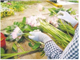
花束加工の作業をしている様子

障害者生活支援センターでは、障害のある人が職場を体験することや、自分に合った仕事を見つけることで就業意欲を高めるために職場の体験実習を行います。就労の経験がない人、自分に合った仕事を探してみたい人は、ぜひ参加ください。 7月21日(金)から随時開始(事前オリエンテーションあり) 花束加工、新聞の折り込み、公園の管理、清掃など 《体験コース》 1人3日間の職場体験実習(支援員の補助あり) 《実習コース》 1人10日間の職場体験実習