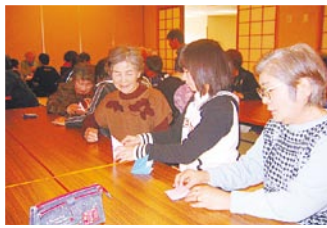
クリスマス会で子どもと楽しい折り紙遊び

○福祉協力員を新設 地区内の5行政区から各1人ずつ福祉協力員を選出し、活動の充実を図りました。 ○地域の子どもの参加促進