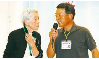
参加者へのインタビュー「健康の秘けつを教えてください！」

つきましては、ご意見などを寄せられる場合は、必須項目に必ずご記入いただけますよう、お願いします。