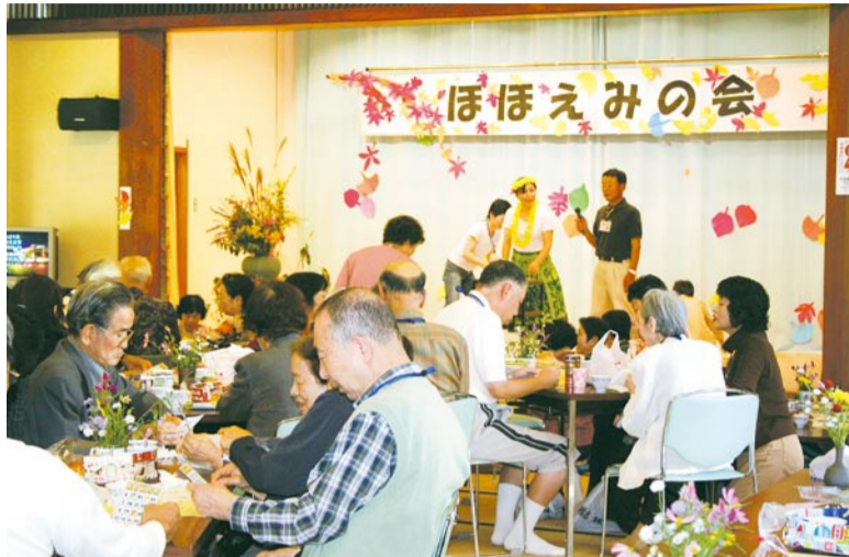
みんなでビンゴゲーム。なかなか当たらないなあ…

当日は晴天に恵まれ、日ごと、外出の機会が少ない高齢者や障害のある人など65人が参加しました。 自慢のものを披露したり、華やかなフラダンスや炭坑節を踊ったり、ゲームや体操を楽しむなど、楽しい一日を過ごしました。 参加者からは、「腰が悪く、普段は杖を使っているですが、みなさんと一緒に炭坑節を踊ったら、腰の痛みが取れました。次回も楽しみにしています」「いつもは、ヘルパーさんとゆっくり話をすることがなかなかできませんが、今日は一日たくさん話をする事ができて、ヘルパーさんがより身近に感じられるようになりました」との声が聞かれました。 参加者の明るい笑顔が印象的でした。