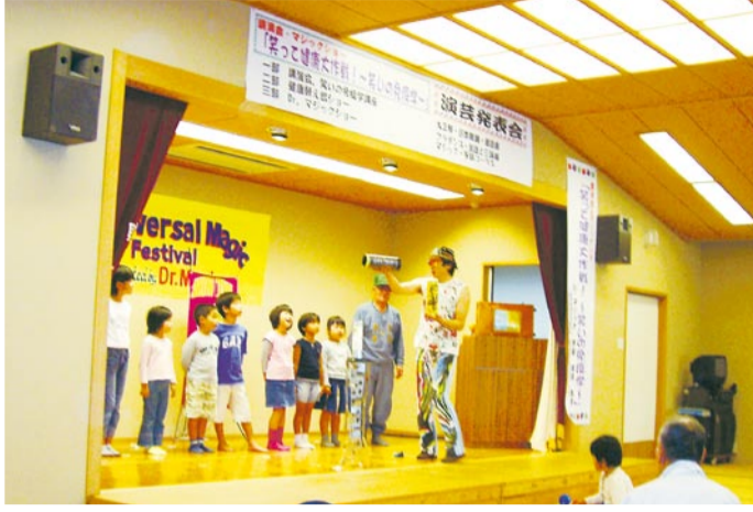
マジックをとおして笑いと驚きの連続！ にわかちびっこマジシャン誕生

10月29日、市保健福祉会館「ゆうゆうぷらざ」を会場に「ゆうゆうまつりin玄海」を開催しました。今年度は玄海4地区コミュニティによる共同開催で実施され、例年以上にバサール出店数なども増え賑わいました。