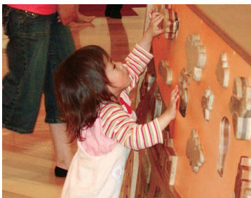
「よいしょ! ベットンコー」木のパズルもたのしいね

かわいい友だちを迎えて、平成20年度がスタートした「のぞみ園」では、4月23日に北九州子育て交流センター「元気のもり」に出かけました。 楽しく歌いながらバスに揺られること1時間、初めての「元気のもり」は、子どもたちにやさしい木の遊具がいっぱいで、子どもも大人も時間を忘れて楽しみました。帰りのバスの中では、あちらこちらから「かわいい寝息が聞こえています。春の遠足から始まった