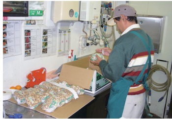
野菜に値段や産地のシールをはっています

仕事の経験がなく、どうしてもが知りたい人、自分に合った仕事を探してみたい人は、ぜひ参加してください。 期間 7月25日(金)から随時開始 事前オリエンテーションあり 内容 市内の事業所での清掃作業、商品管理、販売補助、事務作業など 《体験コース》 1人3日間の職場体験 《実習コース》 1人7日間の職場実習 両コースとも必要に応じて支援員の補助あり