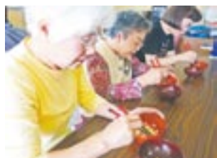
サロンで豆つかみを競い合っているところ。楽しみながらも、脳の刺激となります。