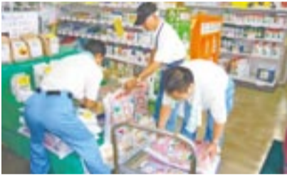
店舗での商品搬入作業