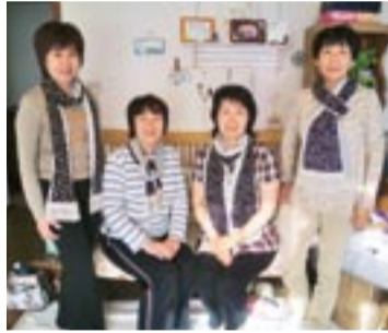
和気あいあいのサロンで作ったストール。今年の冬は暖かく過ごせそう