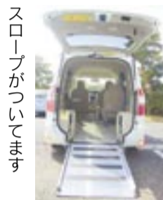
スロープがついています