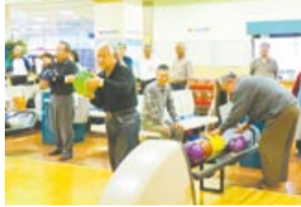
さあ、いくぞ！目指すはストライク！

また、後援・協賛くださった企業や団体から、協賛金や多くの賞品を提供していただき、盛況のうちに終了することができました。参加者や企業・団体からのチャリティ総額は25万3420円になり、地域の福祉向上に有効に活用させていただきます。誠にありがとうございました。