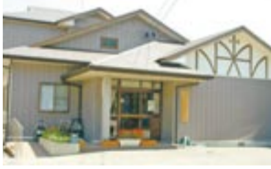
大島の「ふれ愛センター」

「悠・友・湯・遊」、いろいろな「ゆう」の意味を持つ「ゆうゆうぷらざ」。家族や友人と一緒に、ゆったり、のんびり利用しましょう。