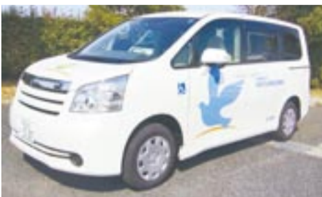
贈られた福祉車両

車イスを利用して家族や友達とのちょっとした外出から、一泊程度の旅行などに利用してください。