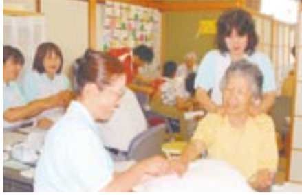
アロマオイルでハンドマッサージ「気持ちい〜」