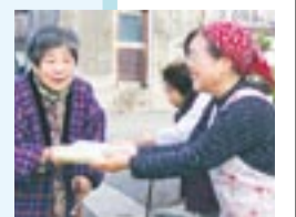
お弁当を笑顔で受け取っています