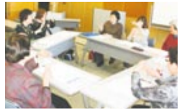
きめ細やかな指導のもとで励んでいます