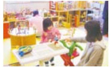
笑顔いっぱい、ぬくもりいっぱいの部屋です