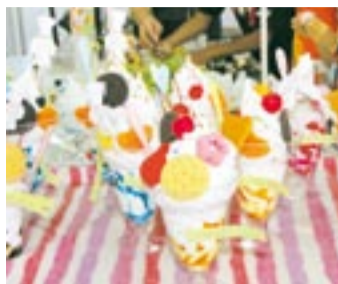
本物みたいでしょ。完成した食品サンプル(パフェ)

●申込先 同センター *第1土、日曜日・祝日の申込はファックスかメール(v-net@city.munakata.fukuoka.jp)で受付