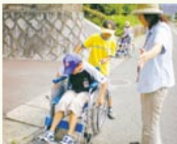
子どもたちは赤間の街を車いすで体験しました

その時、車いすを使わなければならないことの不便さを感じ取っている子どももいましたが、「車いすはおもしろい」と考える子どももいました。そこで今回は、自分たちが普段通る道での車いす体験を通して、車いすに乗っている人がどのような不便さ、不安感を味