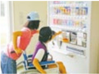
赤間コミセン内にある自動販売機「これなら、車いすの人にも利用しやすいネ！」

は、5年生の時は学校内を、6年生の時は学校の外に出て、実際に車いすを利用している人の生活に密着した地域での体験学習を実施しました。