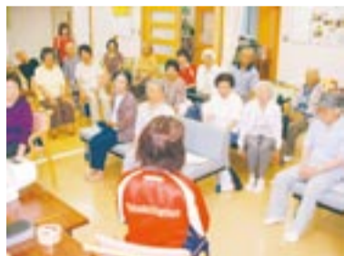
『お茶の間筋トレ』毎日続けてみてください〜!!

大島福祉センター(ふれ愛センター)で7月17日、「第5回 健康・福祉ミニまつり」が盛況に開催されました。