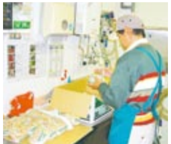
スーパーで青果の商品準備作業

同センターでは、障がいのある人が職場を体験することや、自分に合った仕事を見つけることで就労意欲を高めてもらう