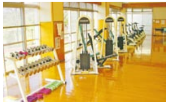
運動器具でいい汗を流しましょう