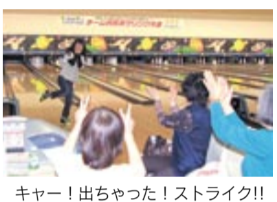
キャー！出ちゃった！ストライク!!

市社会福祉協議会では、2月25日、宗像シティボウルと共催で、チャリティボウリング大会を開催しました。この大会は、ボウリングを楽しむながらチャリティに参加してもらい、健康づくりと福祉への関心を高めてもらうために開催しています。