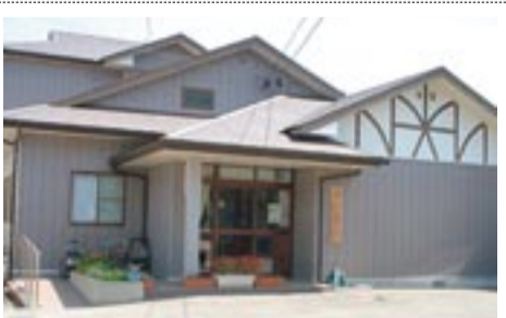
大島の「ふれ愛センター」気軽に立ち寄り下さい

料金については料金表をご覧ください。詳しくはお問い合わせください。 ●場所 大島1809番地32 ●問い合わせ先 ☎(72) 2294