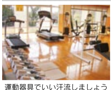
運動器具でいい汗流しましょう