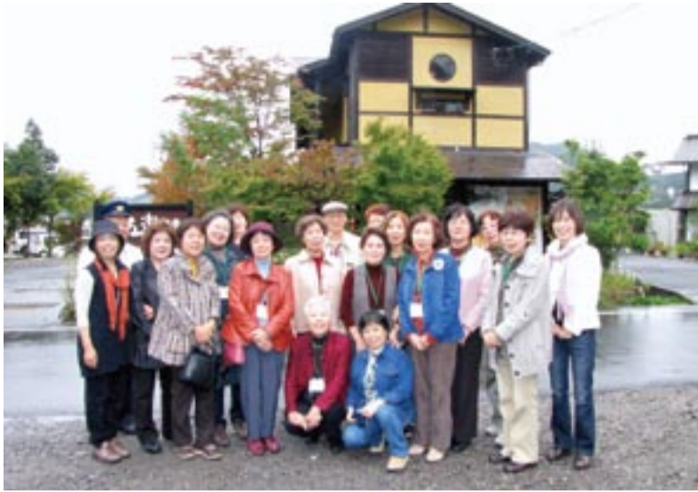
昨年度在宅介護者1泊リフレッシュセミナーの様子

市内在住で、在宅介護をしている人を対象に「在宅介護者1泊リフレッシュセミナー」を開催します。 このセミナーは、在宅介護者のリフレッシュと学習会（個別相談）を兼ね