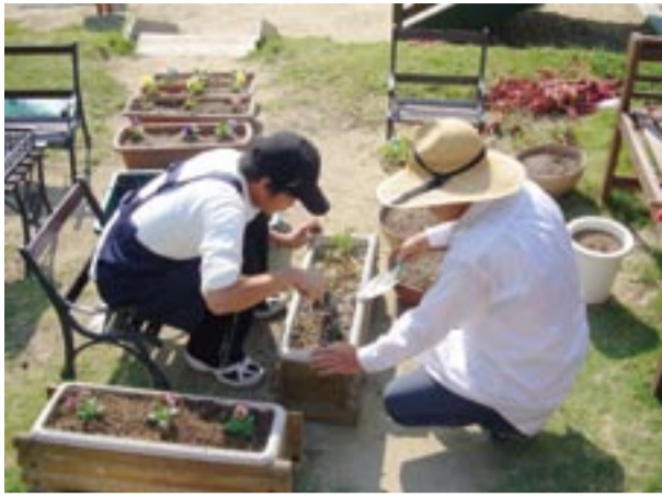
保育園での園庭整備の様子

障害者生活支援センター 土曜日は、祝日を除く、午前8時30分〜午後5時 ☎(34)24111 ファックス☎(34)24222 メールアドレス aaw091800@hkg.odn.ne.jp