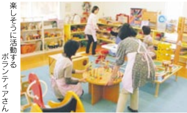
● 障がいの児・者やその家族、学校、楽しそくに活動するボランティアさん

施設など *無償で貸し出しますが、利用の際は、登録が必要 ●日時 毎週木曜と第2・4土曜日、いずれも午後2時～同4時 ■場所 メイトム宗像敷地内 居宅介護支援センター1階