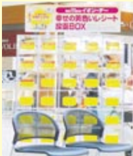
この投函BOXに黄色いレシートを入れます!

「イオン 幸せの黄色いレシートキャンペーン」は、毎月11日に、買い物をした後に発行される黄色いレシートを地域のボランティアに寄付して、そのレシートのお買い上げ金額合計の1%をそれぞれの団体に品物として寄贈する仕組みです。