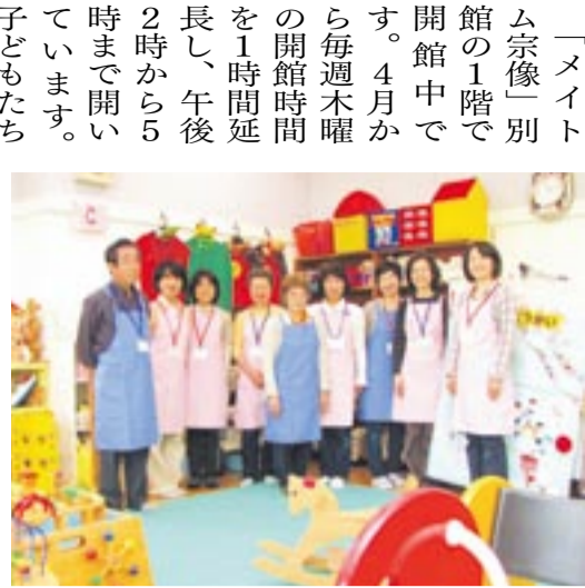
たくさんの笑顔とふれ合えるボランティア活動です

「メイトム宗像」別館の1階で開館中です。4月から毎週木曜の開館時間を1時間延長し、午後2時から5時まで開いています。子どもたちの遊び場、保護者のみなさんの交流場所として、ぜひ利用してください。