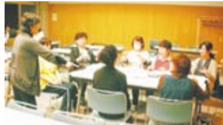
学びながら楽しむ、そんな講習会です