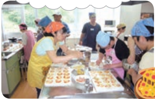
きれいにピザ焼けるかなあ～

トッピングし、フライパンで焼けば簡単ピザの出来上がり。デザートには「みかんゼリー」を作りました。みんなで一緒に作った味はまた格別です。「簡単なものにおいしかったね」「家でもまた作ってみようかな」と、話も盛り上がり、交流を深めました。