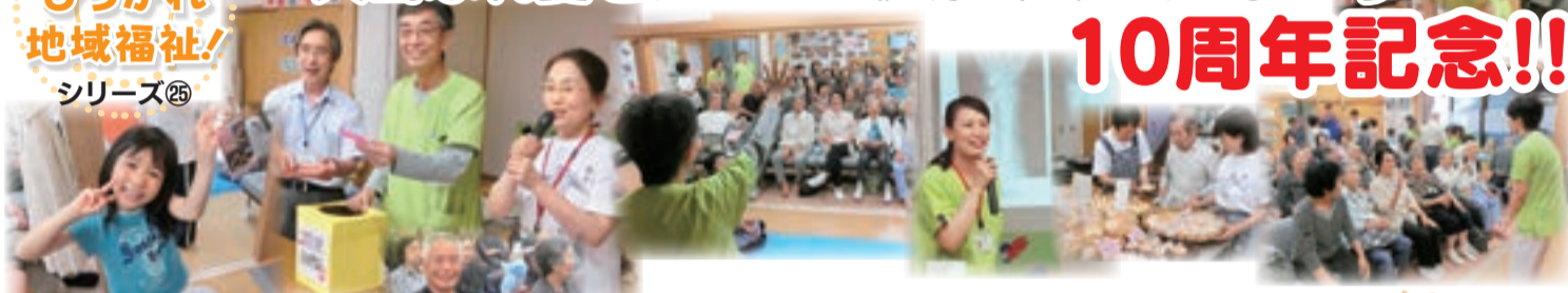
「10周年記念お楽しみ抽選会で豪華賞品をゲット!!!」

「よつづか」の職員による「夏の皮膚の守り方」「転倒予防」「健口(けんこう)体操」についての講義があ