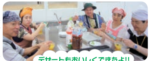
デザートもおいしくできましたよ!!