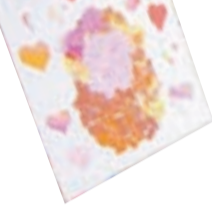
味がある人の参加を待っています。