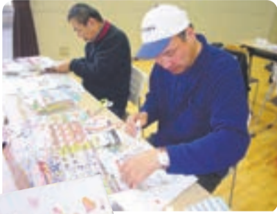
どの色を使おうかな