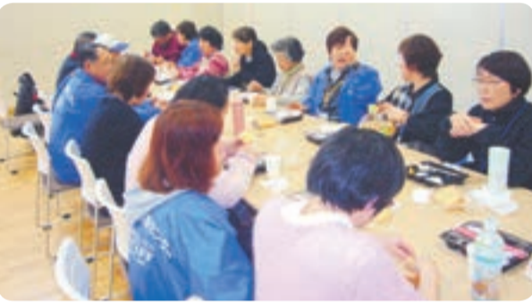
みんなで楽しくおしゃべり