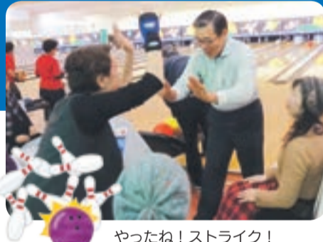
やったね! ストライク!

和風レス トラン末 宿舎ひび き/龍王 館宗像店 焼肉漢 江/シャ ダイサラ ダ館宗像 南店/宗