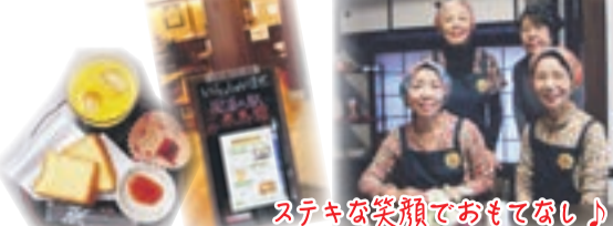
ステキな笑顔でおもてなし♪