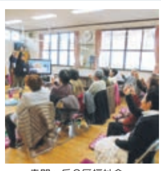
赤間ヶ丘2区福祉会 いきいきふれあいサロンにて