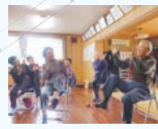
城山区福祉会 ケアピクス!