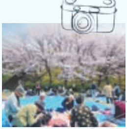
赤間ヶ丘2区福祉会 お花見♪