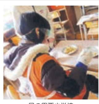
日の里西小学校 「福祉教育学習」