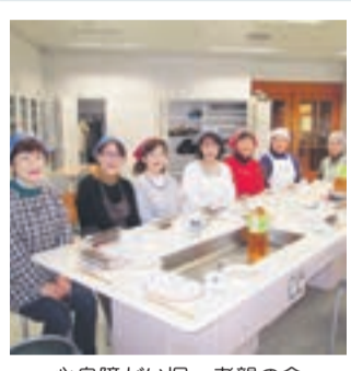
心身障がい児・者親の会 「あゆみの会サロン活動紹介」