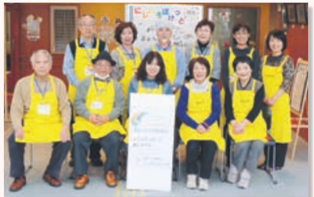
あやのこどもをすくえるおたけい♡