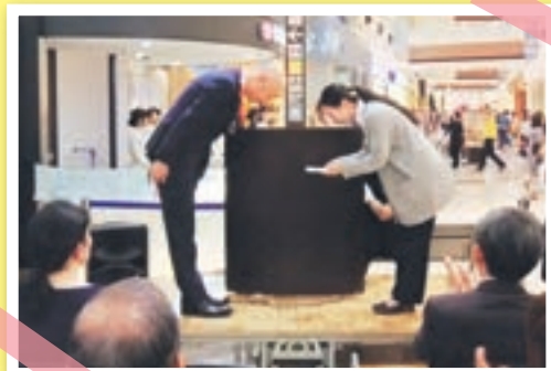
イオンモール福津店から寄付を受け取る 宗像市社会福祉協議会

「イオン 幸せの黄色いレシートキャンペーン」は、毎月11日に、お客さんが受け取った黄色いレシートを、地域のボランティア団体名などが書かれたボックスへ投函します。そのレシートのお買い上げ金額合計の1%をそれぞれの団体に品物として寄贈する仕組みです。 4月22日にイオンモール福津店で贈呈式があり、本会に2,900円分のギフトカードが寄付されました。 普段の買い物が地域貢献につながるという仕組みとみなさんの心遣いに感謝します。