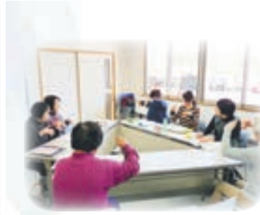
丁寧な指導で学べます

市内2会場にて新年度「話し講習会」を開催中です。全コース初心者向けのクラスもあり、見学も歓迎です。 ●受講料は年間500円。別途テキスト代が200円程度必要です ■申し込み・問い合わせセンター