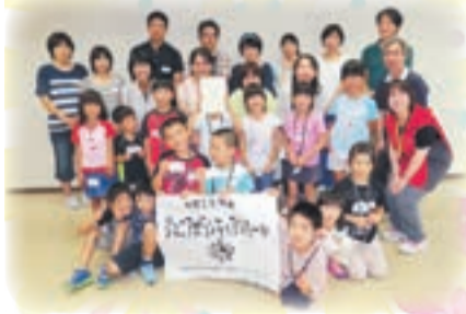
●バンビコース 日程・内容・会場