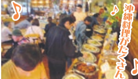
沖縄料理がたっさん

ランチ終了後は、初夏の花々を観賞。緑花彩る自然の中に赤や白のバラが咲き、とても奇麗で心が癒やされました。最後は、参加者全員で記念撮影。参加者からは「心もおなかも大満足」といった声が聞かれ、早くも次回のピアサポート事業を心待ちにしている様子でした。