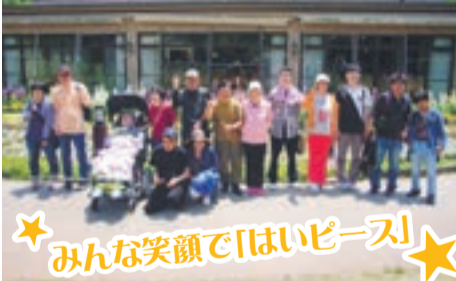
★みんな笑顔で「はいピース」★