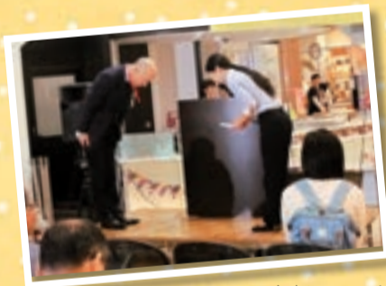
イオンモール福津店から寄付を受け取る宗像市社会福祉協議会

10月21日にイオンモール福津店で贈呈式があり、本会に2,600円分のギフトカードが寄付されました。