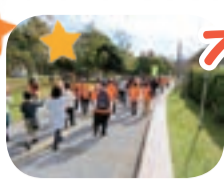
オレンジの列が 続きました