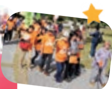
秋晴れの中での パレード

「RUN伴 (らんとも)」とは、日本全国のまちが、認知症になっても安心して暮らせる地域になることを目指して、認知症のある人とともにタスキをつなぐ列島リレーです。平成23年度に始まり、現在は北海道から沖縄県まで広がっている認知症啓発イベントです。