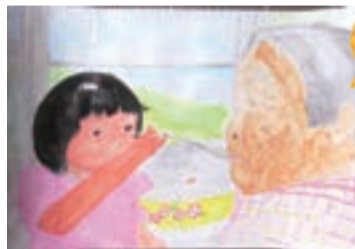
「私とひいおばあちゃん」