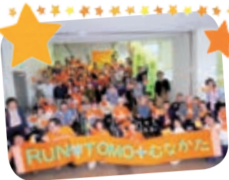
ゴール後、笑顔いっぱい...