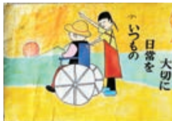
「車いすに乗った人を押す人」