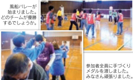
風船バレーが始まりました。どのチームが優勝するでしょうか。