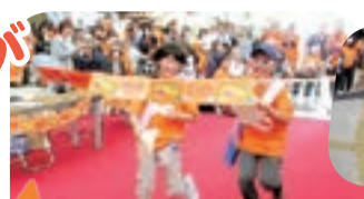
たすきをつなげました!