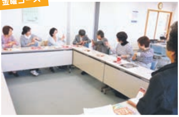
教えあい、みんなで上達