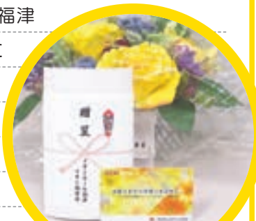
イオンモール福津店から寄付いただいたギフトカード

普段の買い物が地域貢献につながるという仕組みと、みなさんの心づかいに感謝します。