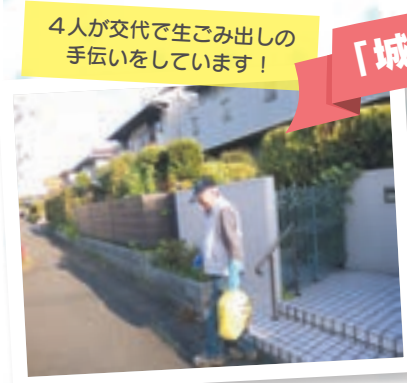
4人が交代で生ごみ出しの手伝いをしています!

平成30年8月1日 発行 社会福祉法人 宗像市社会福祉協議会 〒811-3437 宗像市久原180 メイトム宗像2階 TEL 0940-37-1300