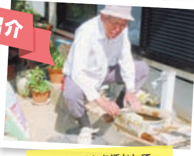
得意なことを活かして活動しています♪

●城西ヶ丘の高齢化率は、約38%（平成30年5月末現在）。年々増加する高齢化率に住民自身が見守りネットワーク活動の必要性を感じ、平成27年10月より「城西ヶ丘見守りネットワークむすび愛」（以下、「むすび愛」）が結成されました。