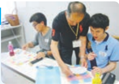
きれいな模様に染まりました。