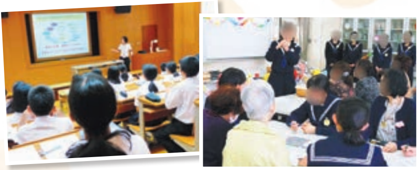
認知症サポーター養成講座は、出前講座にて市内各所で実施中です。詳細は市社協まで問い合わせてください。

今回は、今年度から中学1年生も受講して中高一貫で認知症支援に取り組んでいる県立宗像中学校・高等学校の様子を紹介します。