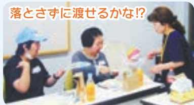
落とさずに渡せるかな!?

今回、初めてピアサポート事業に参加した人からは「きれいな模様ができて、とても楽しかった。また参加したい」と感想を聞くことができ、スタッフにとっても思い出に残る楽しい一日となりました。