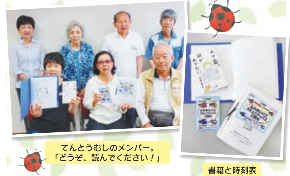
てんとうむしのメンバー。「どうぞ、読んでください!」