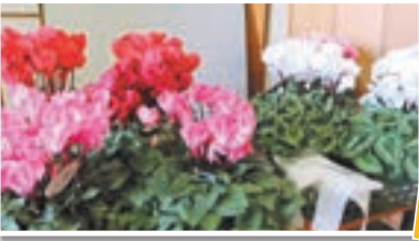
令和元年忘年大会 賞品のシクラメン

地域にはサロン活動やさまざまな趣味の集まり、支え合いの活動があります。地域で暮らしている人の「知恵」や「工夫」、「特技」をはじめ、近所づきあいや仲間同士の集まり、公民館を活用した活動などを「地域のお宝（地域資源）」と呼んでいます。