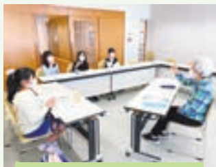
子どもクラスもあります