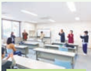
和やかな雰囲気です