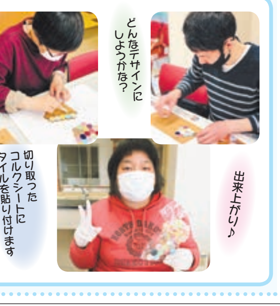
切り取ったコルクシートにタイルを貼り付けます