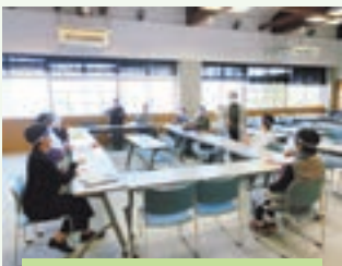
手話を基礎から学べます