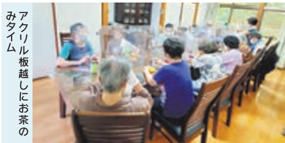
アクリル板越しにお茶のみタイム

新型コロナウイルス感染拡大により、高齢者の集いの場をはじめ地域のさまざまな活動が制限を余儀なくされました。そうした中、開催を決定した日の里7丁目おしゃべりサロン。決断に至るまでには、自治会長をはじめ福祉会の役員、民生委員、福祉員の人々の慎重かつ、前向きな協議がありました。地域の高齢者に対して何ができるのか、日の里7丁目では地域住民に寄り添った地域福祉活動を展開しています。