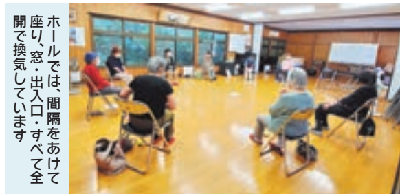
ホールでは間隔をあけて 座り窓・出入口・すべて全 開で換気しています