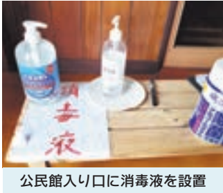
公民館入り口に消毒液を設置