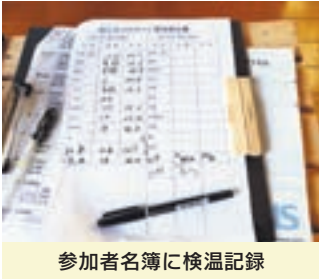
参加者名簿に検温記録