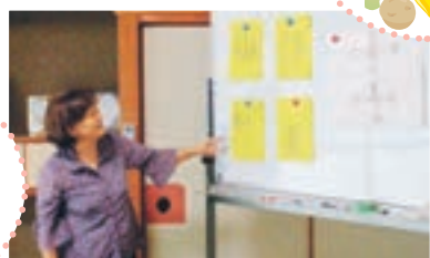
笑いも交えながら脳トレです