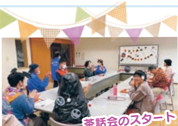
茶話会のスタート