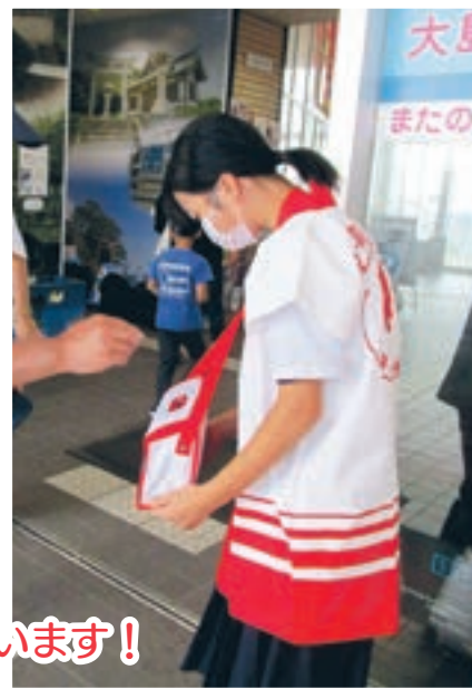
募金活動中の大島学園生徒