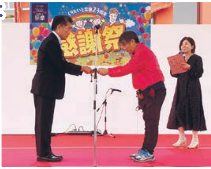
ステージでの授与式