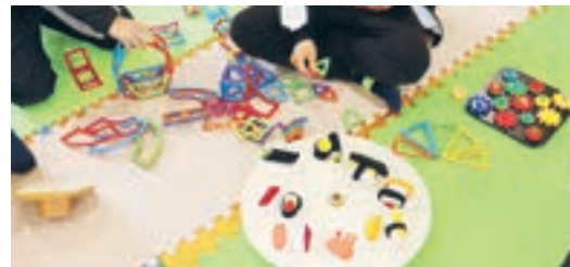
出張おもちゃ図書館