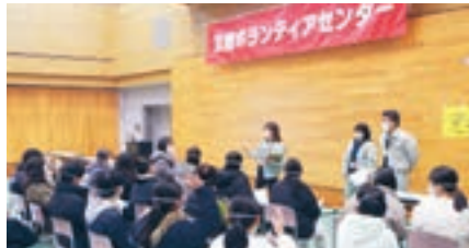
災害ボランティアセンター設置訓練