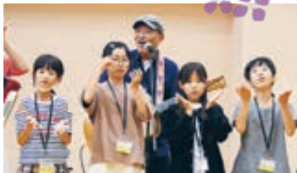
ジュニアボランティアスクール