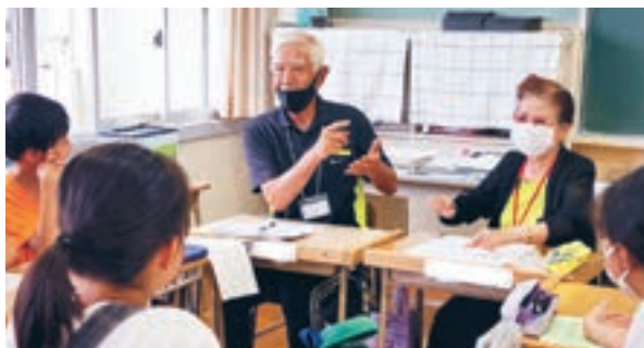
地域の高齢者の方と交流