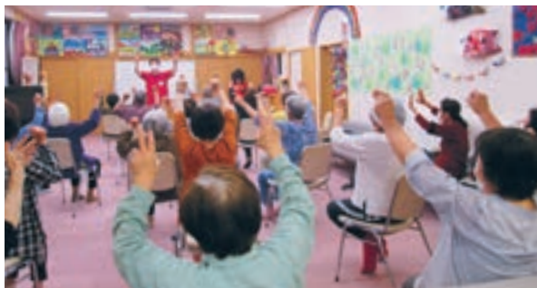
おおしまDEいきいき元気教室