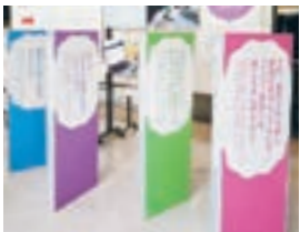
昨年のパネル展示

日常生活で差別につながる「言葉」「行動」「状況」に焦点を当て、具体的な例をもとに考えるパネル展です。