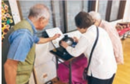
展示作品について説明しています

が咲き、参加者同士がゆったりとした時間を共有しています。日常の何気ない会話の中から、お悩み相談や情報交換が行われることもあり、心の支えとなる場としての役割も果たしています。