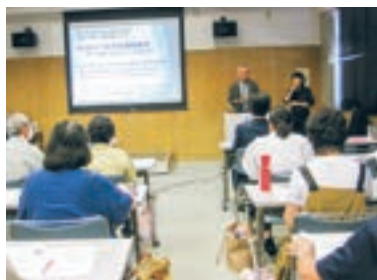
福祉教育セミナー