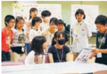
ジュニアボランティアスクール