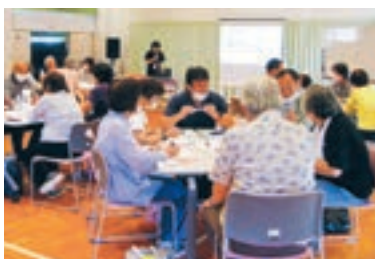
協議体(地域支え合い会議)