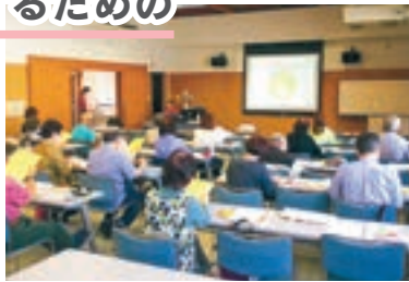
認知症サポーターの養成