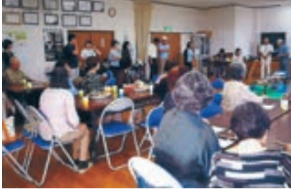
縁側カフェの様子

参加者は高齢者を中心に、子どもやその親世代まで幅広く、世代を超えた交流の場になっていきます。お茶やコーヒーを飲みながら世間話に花