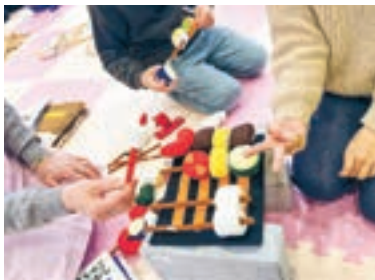
出張おもちゃ図書館の様子