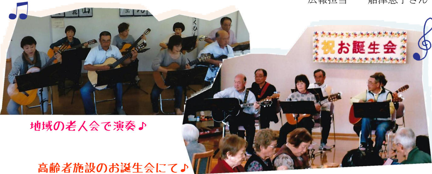
地域の老人会で演奏♪