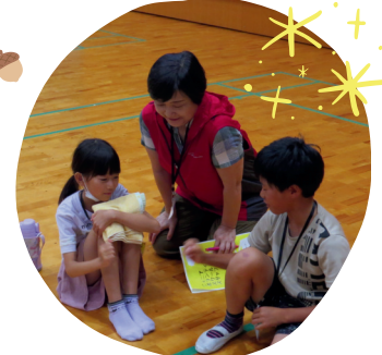
ジュニアボランティアスクールの子どもたちと一緒に活動しました

普段は、ライアーという癒しの楽器と箱庭（心理療法）を使い、心に寄り添う活動をしています。これからも、いろんな場所（自然の中でも）へ出向き、たくさんの方へライアーの癒しの音を届けていきたいです。