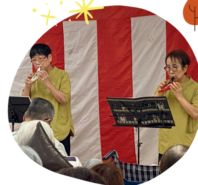
オカリナ演奏 ギター漫談など、演目も豊富