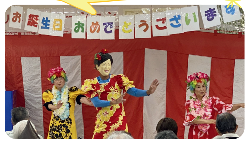
福祉施設のお誕生日会での上演♪ オリジナルの踊りで笑顔を呼びます