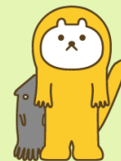
みなかたのテンちゃん