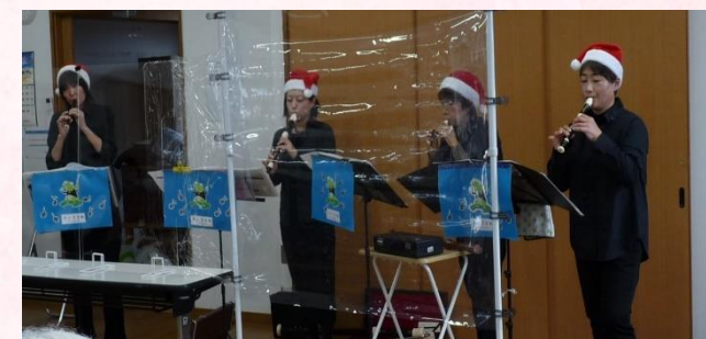
池の音楽隊♪の皆さん